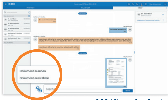
C-BOX Chat mit Scan-Funktion

Nutzen Sie die Flexibilität der neuen C-BOX! Sie kann problemlos um zusätzliche Funktionen erweitert werden, beispielsweise zur Übermittlung von Honorarnoten an WAHonline*.